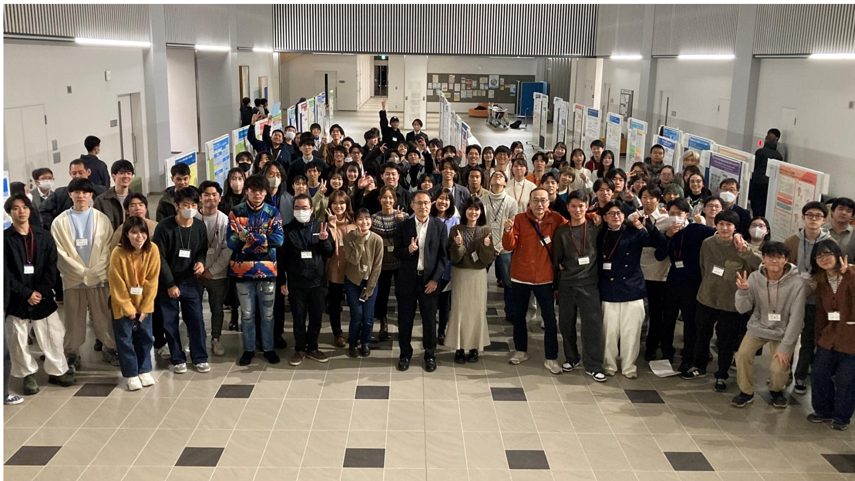
写真⑥：ポスター報告会後の記念撮影