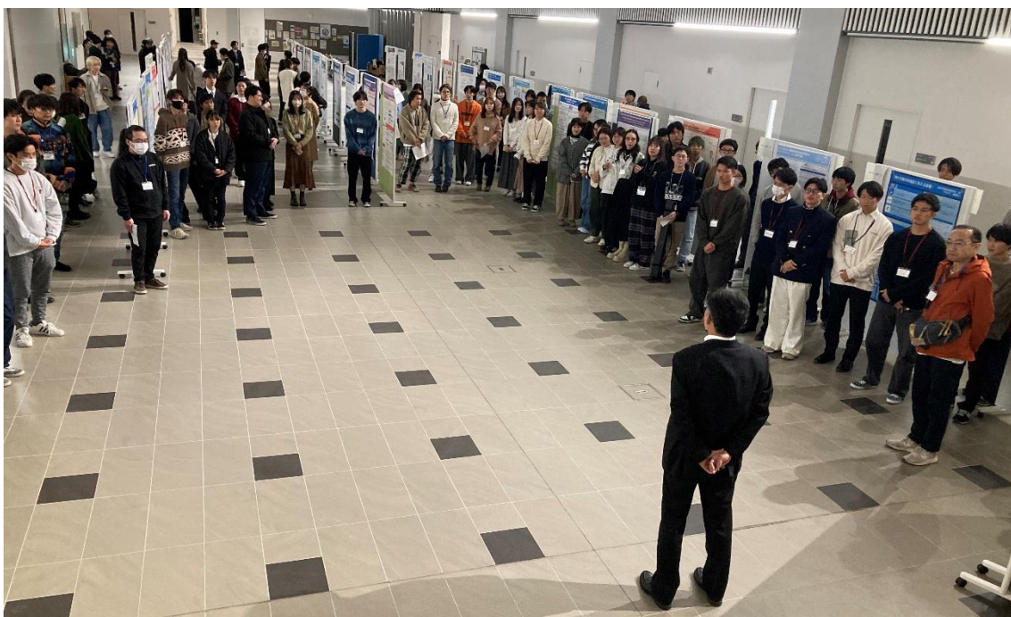
写真⑤：閉会式の様子